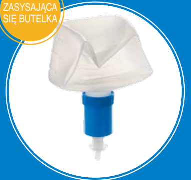
ZASYSAJĄCA SIĘ BUTELKA